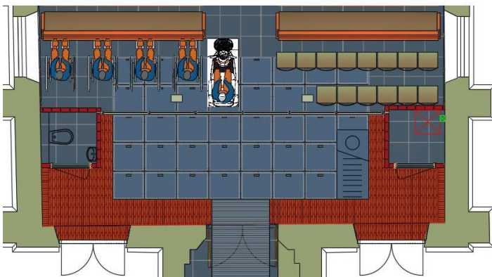
Plaats voor mindervalide gemeenteleden

De ruimte achter de banken kan nu namelijk benut worden door onze mede- en toekomstige gemeenteleden die slecht ter been zijn, aan een rolstoel en/of scootmobiel gebonden zijn.