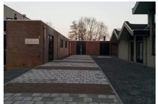
Entree kerk in de Milandhof