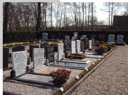
Eigen en algemene graven