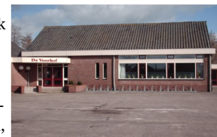
Kerkelijk centrum 'De Voorhof', Hoofdweg 48, Zegveld

De algemene kerkelijke begraafplaats kan gebruik maken van de faciliteiten geboden in het kerkelijk centrum 'De Voorhof'. 'De Voorhof' kan als mortuarium gebruikt worden, heeft ontvangstruimten en condoleance kamers. Ook kan in de grote zaal een rouw- of afscheidsdienst gehouden worden. Rouwdiensten kunnen uiteraard ook worden gehouden in het kerkgebouw. In overleg met de uitvaartverzorger en de beheerder van 'De Voorhof' kunt u uw keuze voor de verschillende ruimtes kenbaar maken.